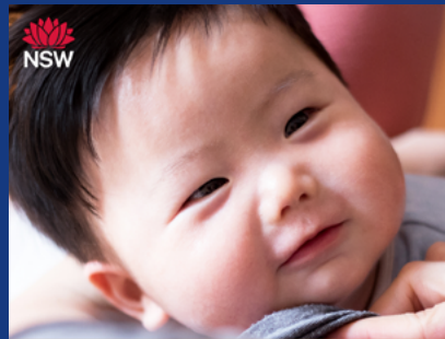
按時免疫保護子女

瀏覽 health.nsw.gov.au/vaccinate ，檢查新州疫苗接種時間表瞭解您子女下次接種疫苗的時間。