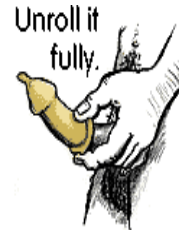
Unroll it fully.