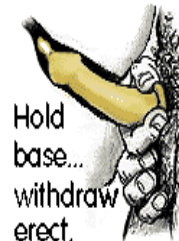
Hold base... withdraw erect.

반드시 수성 윤활제를 사용합니다. 기름이나 바셀린을 사용하면 안됩니다. 섹스 도중 콘돔이 빠지지 않았는지 확인합니다.