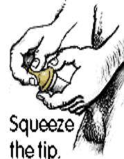
Squeeze the tip.