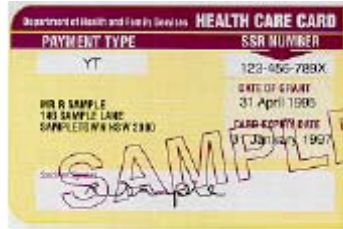
Health Care Card ဆုတ်ချတက်ကဟုကယာ်ခး

စဲထာ်လုး (Centrelink) ဟ့ၣ်ဆုတ်ချတက်ကဟုကယာ်ခးမ့တမ့ၣ် ပုၣ်န့ၣ်တၢ်အိၣ်ဘိၣ်ညီပုၣ်လီၤစ့ၤခး ( Pensioner Concession Card ) ဆုပုၣ်လၢစ့ၤဟဲၣ်တအါဘၣ်, မ့တမ့ၣ်စ့ၤဟဲၣ်တအိၣ်ဘၣ်တဖၣ် လၢအန့ၣ်တၢ်ဘၣ်ဘျးလၢ ပဒိၣ်အအိၣ်ဒီးအဒိးန့ၣ်တၢ်အိၣ်ဘိၣ်ညီအစ့တဖၣ်လီၤ.