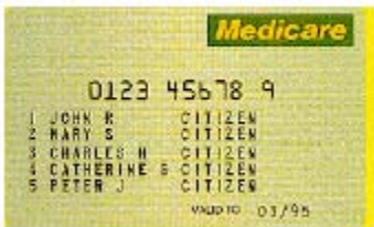
Medicare Cards မဲာ်ဒိတ်ခဲရ်ခး

မဲာ်ဒိတ်ခဲရ်ဟ့ၣ်န့ၢ်တၢ်လၢာ်ဘူၣ်လၢာ်စ့ၤခဲလၢာ် မ့တမ့ၢ်တၢ်လၢာ်ဘူၣ်လၢာ်စ့ၤတနီၤ ဖဲန -