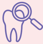
မၤန့မဲအတီက့ထွဲ သမဲသမီးခဲအဲၤခဲအဲၤ တက့