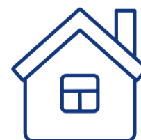
သင် လုပ်နိုင်လျှင် အိမ်၌နေပါ