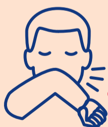
ချောင်းဆိုးခြင်း