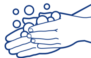
ကောင်းသော တစ်ကိုယ်ရေ သန့်စင်ရေး ကိုလုပ်ပါ

သင်ကိုယ်တိုင် နှင့် အခြားသူများကို ကာကွယ်ပါ။