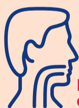
Mal de gorge