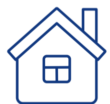
Tetap di rumah kalau bisa