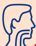
Mal di gola