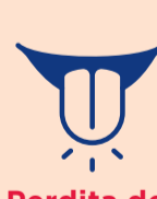
Perdita del gusto