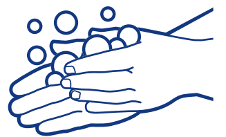
Pakiya baş bi cîh bike