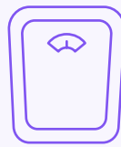
น้ำหนักลด

โดยทั่วไปน้ำหนักของท่านจะไม่ลดมาก เป็นเรื่องปกติที่น้ำหนักจะขึ้นมากกว่าจะลด