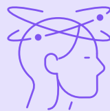
คลื่นไส้

อาจจะเป็นเรื่องปกติที่จะคลื่นไส้บ้างในช่วงไตรมาสแรก แต่ก็เป็นที่จัดการได้และไม่ควรทำให้ไม่สบายตัวมากเกินไป สารน้ำและการพักผ่อนสามารถช่วยบรรเทาอาการได้