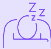
เหน็ดเหนื่อย

ความรู้สึกเหน็ดเหนื่อยบ้างเป็นเรื่องปกติของการตั้งครรภ์ แต่ไม่ควรหยุดยั้งจากการดำเนินชีวิตประจำวัน ละเลยบ้านเรือนหรือดูแลครอบครัวของท่าน