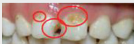
همین حالا یک قرار ملاقات دندانپزشکی بگیرید.