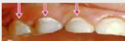
همین حالا یک قرار ملاقات دندانپزشکی بگیرید.