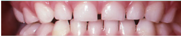
دندان های سالم اطفال.

دندان های طفل خود را بین دیدارهای تان از کلینیک دندان، بطور منظم خودتان معاینه کنید.