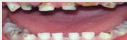
همین حالا معالجه عاجل دندان را بدست بیاورید!