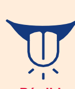
Pérdida del gusto