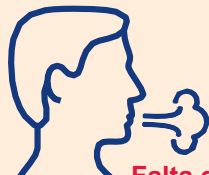
Falta de aire