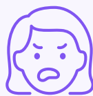
تشویش، افسردگی و انزوا

زنانی که HG دارند، و برای مدتی ناچور و مانده بوده اند، ممکن است احساس انزوا، تشویش و افسردگی هم پیدا کنند. ممکن است تحمل آن برای تان دشوار باشد و نتوانید از دوران حاملگی خود لذت ببرید. ممکن است به خاطر علائمی که دارید، برای برنامه ریزی حاملگی بعدی خود ترس داشته باشید.